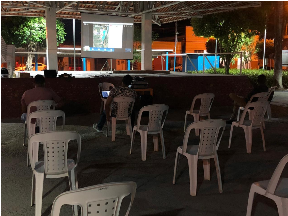
Figura 2 - Fotografia da audiência pública sendo exibida na Praça Derocy Moraes – Centro de Miracema do Tocantins.