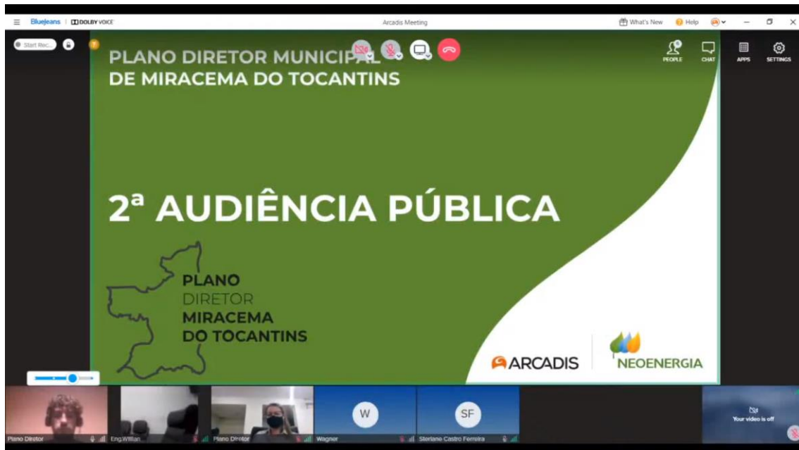
Figura 1 - Usuários presentes na videochamada durante a apresentação da audiência pública