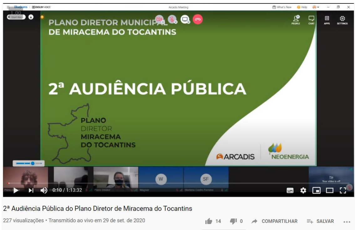
Figura 4 - Captura de tela da gravação da audiência, disponível no YouTube. Destaque para os números: 227 visualizações, com 14 marcações de "gostei". Disponível em: https://www.youtube.com/watch?v=iOx2EzGkSKc . Acesso em 13/10/2020