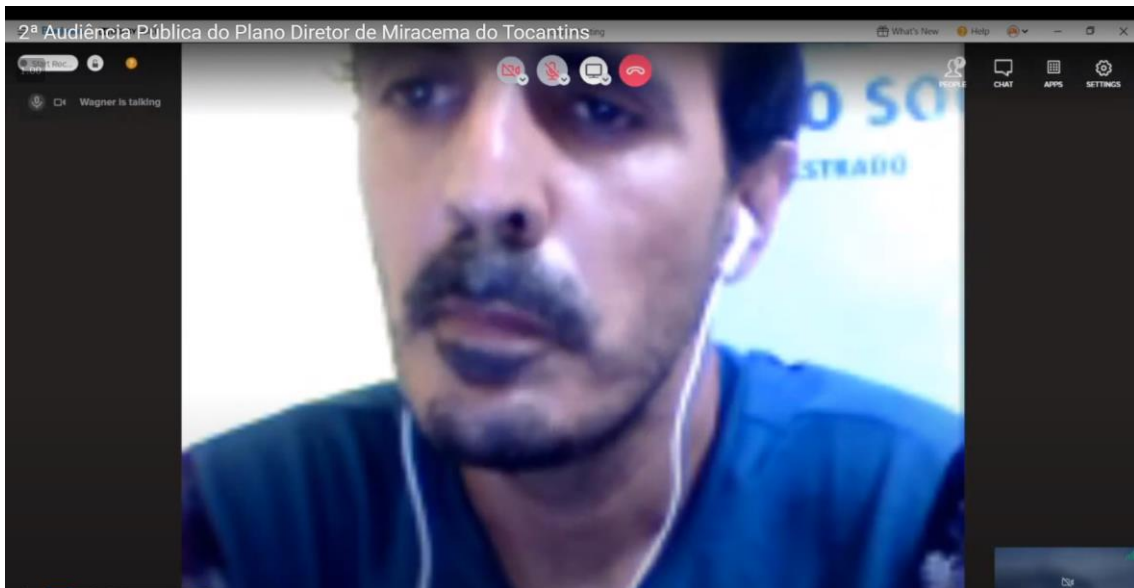
Figura 3 - Captura de tela da fala do Wagner, via aplicativo BlueJeans